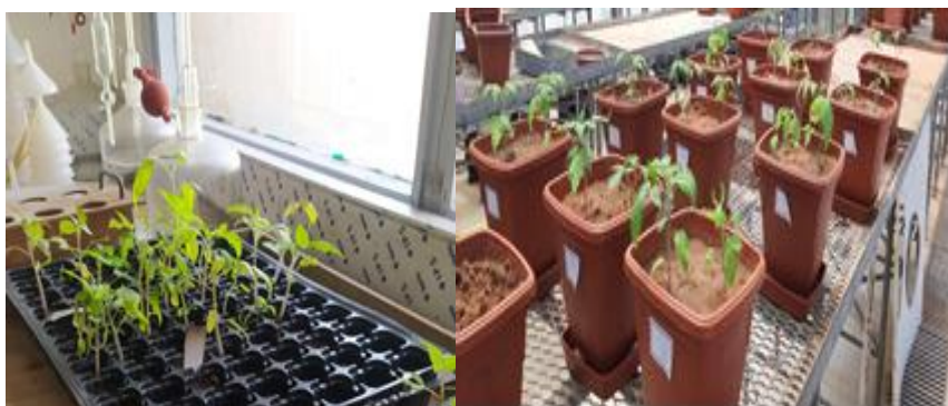
Figure1. Photos des plantations 4 et 6 semaines après germination